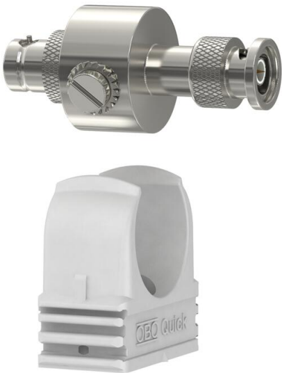
同轴数据线电涌保护器